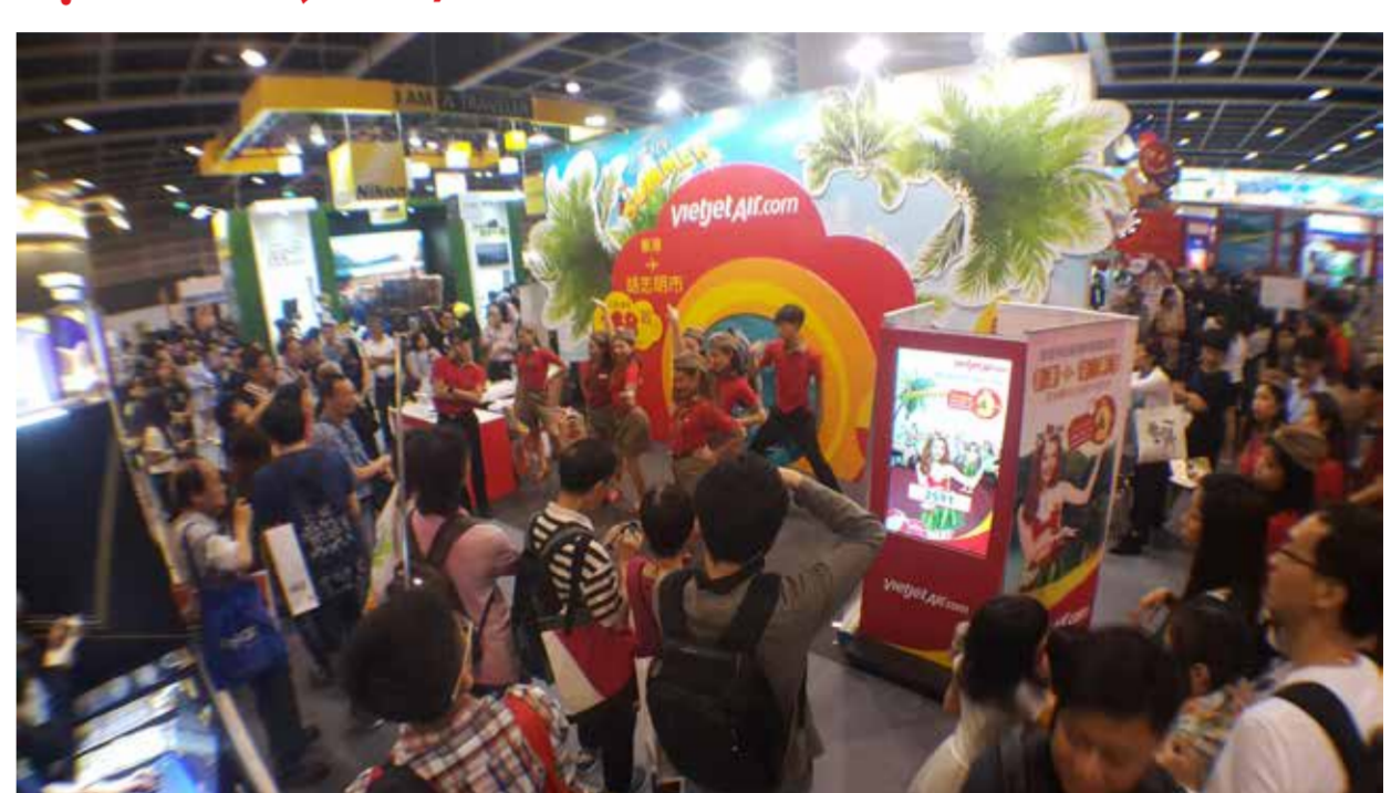
Vietjet cực kỳ thu hút tại Hội chợ Du lịch Quốc tế Hong Kong (ITE) 2017

Trong tháng 6, Vietjet tưng bừng tham gia Hội chợ du lịch quốc tế Hanatour International Travel Show 2017 từ ngày 09/6 - 11/6/2017 tại Trung tâm triển lãm quốc tế Hàn Quốc (KINTEX); Hội chợ Du lịch Quốc tế Hong Kong (ITE) 2017 từ ngày 15/6 - 18/6/2017 tại Trung tâm Hội nghị và Triển lãm Hong Kong (HKCEC) và các hoạt động tại Myanmar Plaza, mang đến du khách màn trình diễn flashmob trẻ trung, sôi động và đẹp mắt, tham gia nhiều trò chơi hấp dẫn nhận các phần quà giá trị và cơ hội mua vé máy bay với giá thật tiết kiệm.